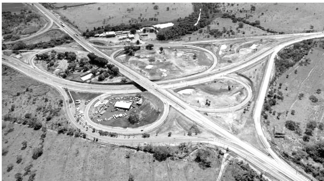
O novo trevão de Monte Alegre de Minas

“Essa obra, esperada há muito tempo, salva vidas. Esse trevo aqui foi feito com R$ 51 milhões da iniciativa privada e, somando esforços, com recursos públicos e privados, vamos garantir aqui em Minas os investimen-