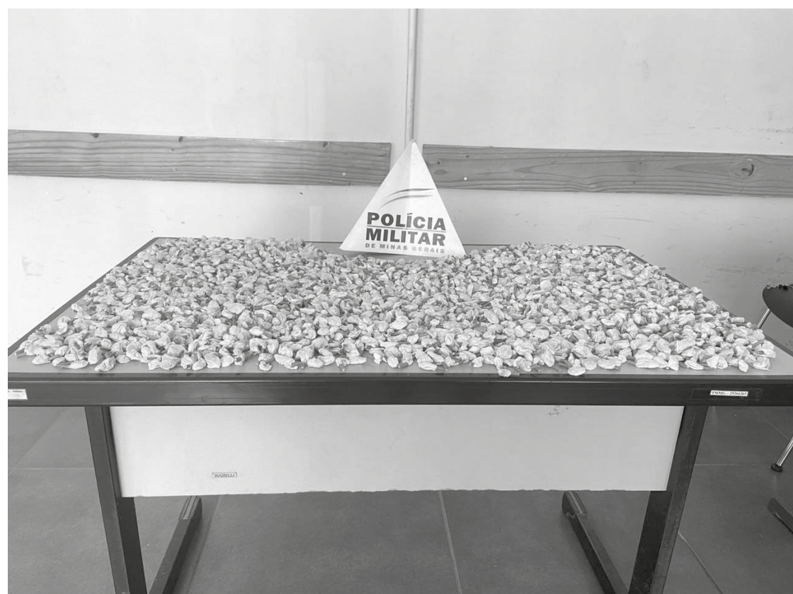
Parte da grande quantidade de cocaína apreendida pela PM