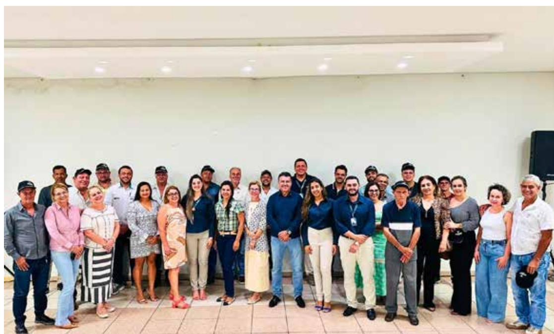
Parte dos integrantes do corpo de cooperados, com a diretoria e colaboradores da Coopacredi de Tupaciguara

No encerramento do evento, todos os presentes foram agraciados com um coquetel, encerrando assim uma noite produtiva e de interação entre os membros da cooperativa e seus líderes.