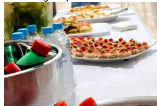
Coquetel oferecido pelo Sicoob Coopacredi