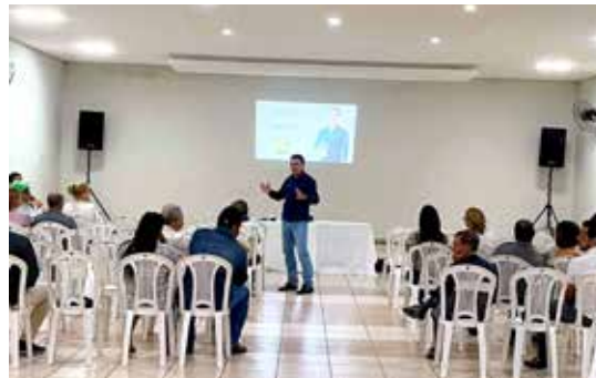
Celio apresentando parte dos serviços oferecidos