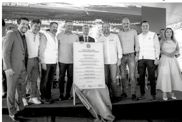
Autoridades que estiveram presentes no evento