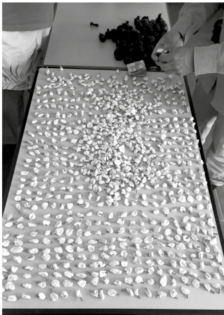
Mais uma parte da droga apreendida

que está seria repassada a outros traficantes que atuam na cidade, e não poder escancarar o nome desses bandidos por proteção de leis que proíbem que a sociedade possa tomar conhecimento desses elementos perniciosos, que vivem em seu seio e que não podem ser identificados, para que todos possam tomar conhecimento de seus atos ilícitos. Hoje a pessoa pode ter um bandido perigoso como vizinho e não saber. É uma pena!!!