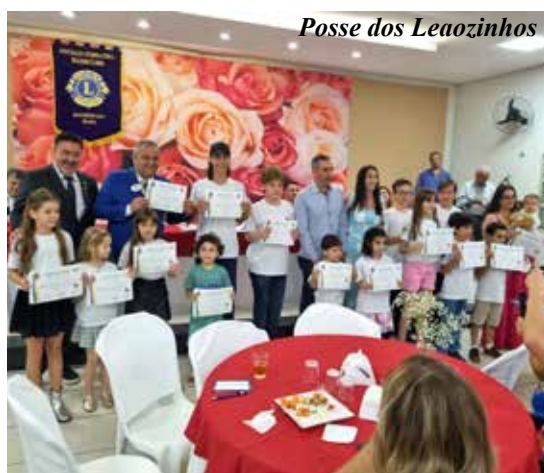
Posse dos Leãozinhos