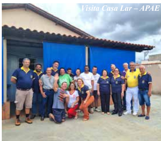
Visita Casa Lar – APAE