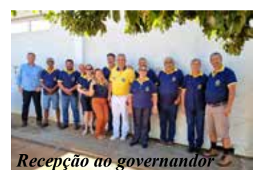
Recepção ao governador