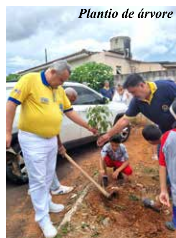
Plantio de árvore