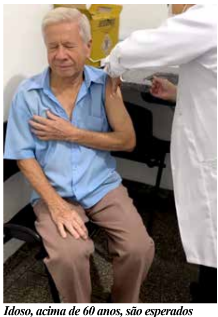
Idoso, acima de 60 anos, são esperados

possível para que a população vulnerável esteja amplamente imunizada, até o final da campanha.