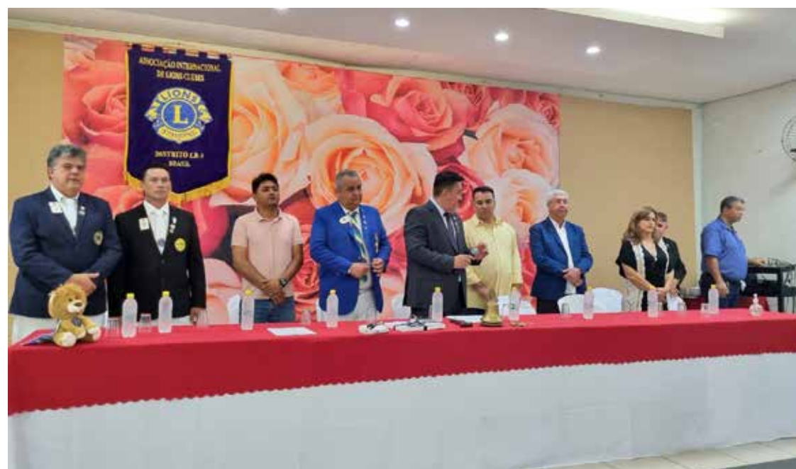
Mesa diretora da Reunião festiva de aniversário do clube

Clube anunciou a reativação do Leo Clube e o lançamento da Campanha Leãozinho, iniciativas que visam proporcionar aos jovens oportunidades únicas de desenvolvimento pessoal e serviço comunitário.