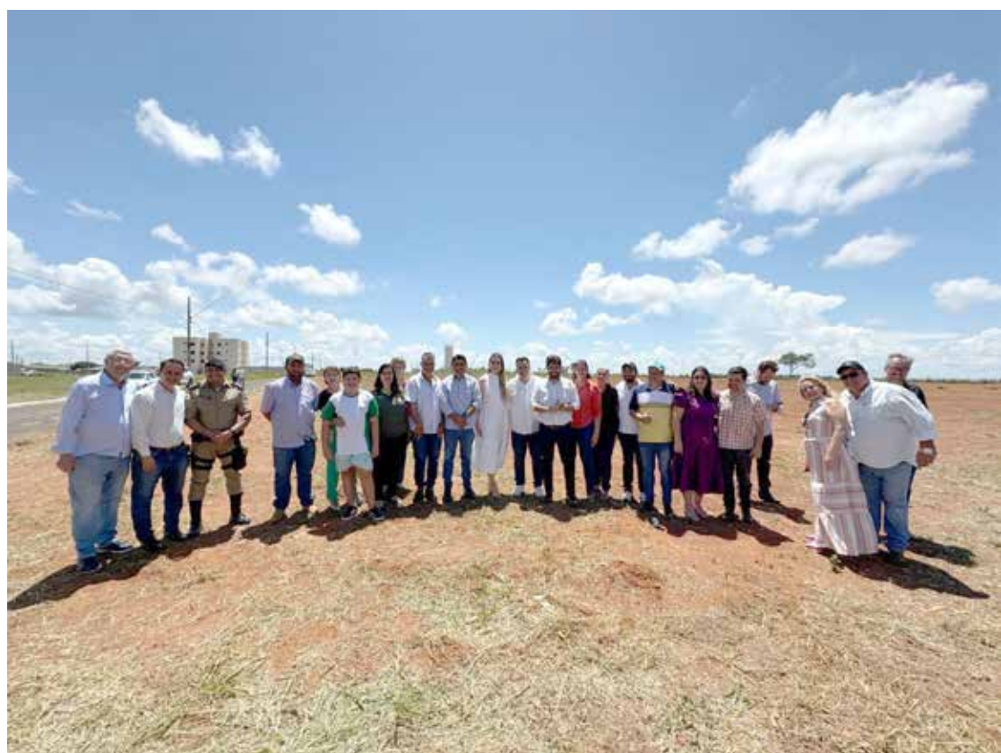
Autoridades e personalidades que estiveram presentes à solenidade, em visita ao local da construção

Com a empresa vencedora da licitação autorizada a iniciar a construção, a expectativa é de que o projeto seja executado de acordo com o cronograma estabelecido, beneficiando toda a comunidade escolar.