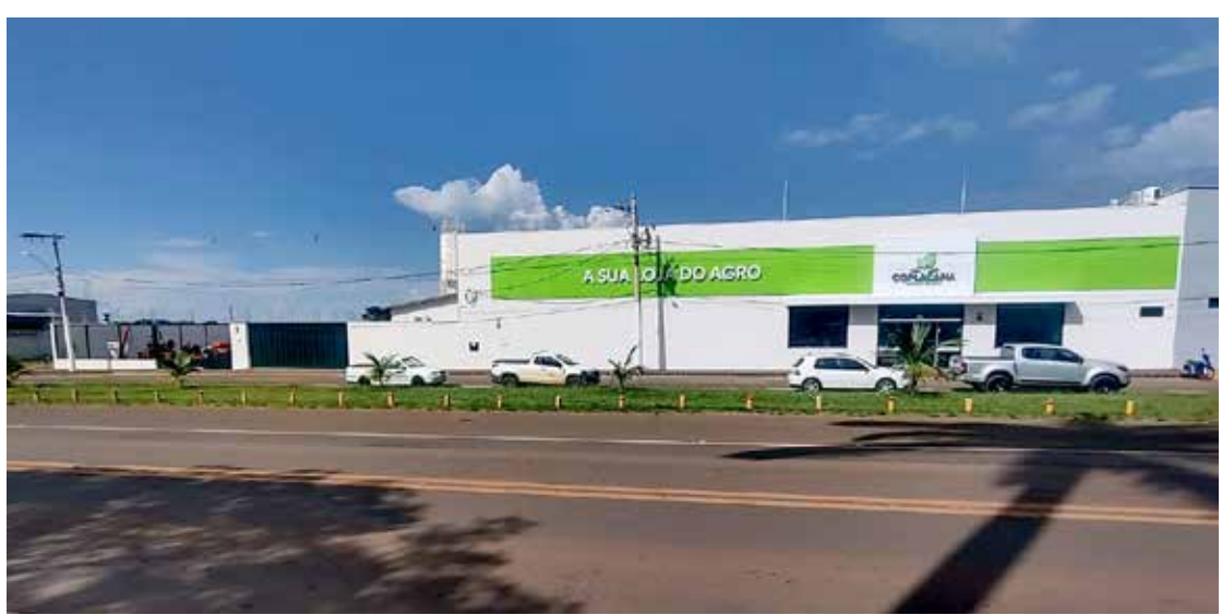
Fachada da loja Coplacana de Tupaciguara

Na unidade de Tupaciguara, os cooperados encontrarão uma estrutura completa, incluindo espaços administrativos exclusivos, salas de agrônomos para assistência personalizada e modernas instalações para reuniões, palestras e treina-