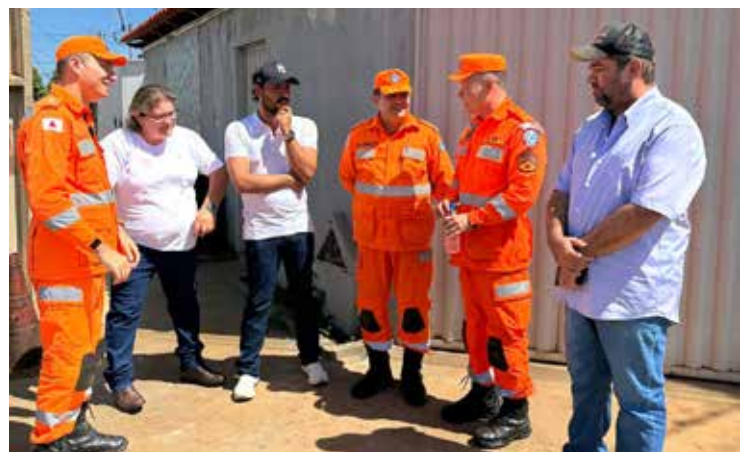
Vereadores reunidos com bombeiros para saberem mais sobre o veículo

A iniciativa ganhou força a partir de uma