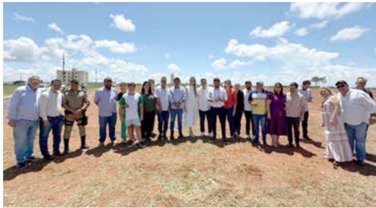
Visita realizada à área onde será erguida a escola

Essa conquista foi possível graças à colaboração entre o Poder Legislativo, que aprovou por unanimidade a execução das obras, o Executivo, que tem demonstrado comprometimento em criar oportunidades para alcançar conquistas importantes em prol da