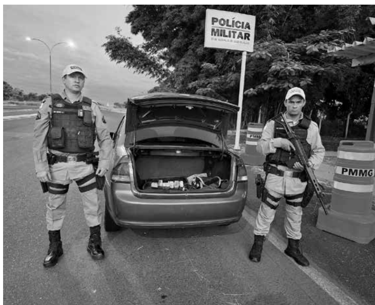
Policiais que participaram da abordagem e prisão da suspeita

Após uma minuciosa inspeção do veículo, os policiais encontraram 13 tabletes de uma substância suspeita, semelhante a maco-