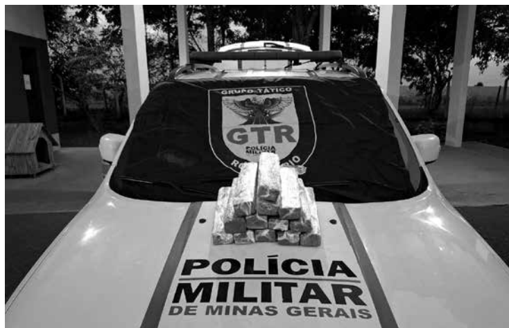
Droga encontrada em poder de D.L.M.

De acordo com os relatos, a autora informou aos policiais que havia aceitado uma corrida pelo aplicativo de caronas "Bla Bla Car" e receberia a quantia de R$ 400 para transportar a droga. Diante desses fatos, os policiais procederam com a prisão em flagrante da suspeita, acusada de tráfico de drogas, e a encaminharam para a Delegacia de Polícia de Tupaciguara para os devidos procedimentos legais.