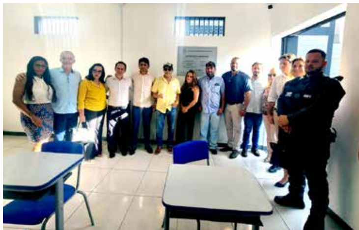
Vereadores presentes na inauguração da Sala de Estudos