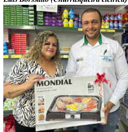
Enilda N. B. (Churrasqueira elétrica)