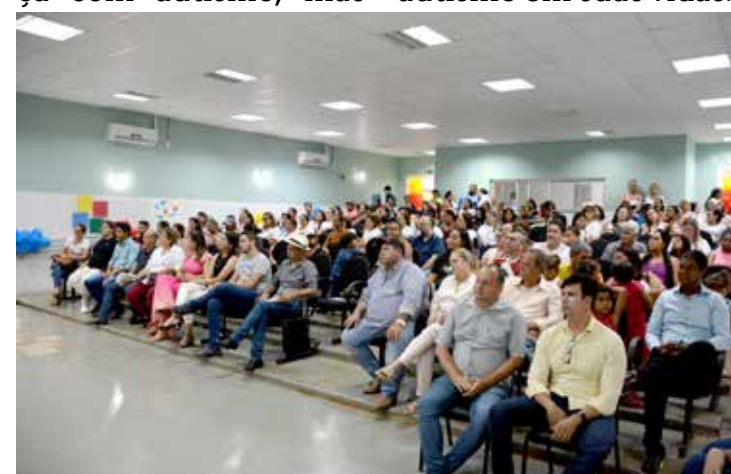
Público presente ao bate-papo

acontece..." Esse evento destaca a necessidade premente de compreensão, apoio e solidariedade a todos que enfrentam o desafio do autismo em suas vidas.