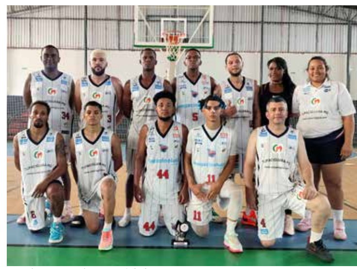
Equipe Tupaciguara Adulta