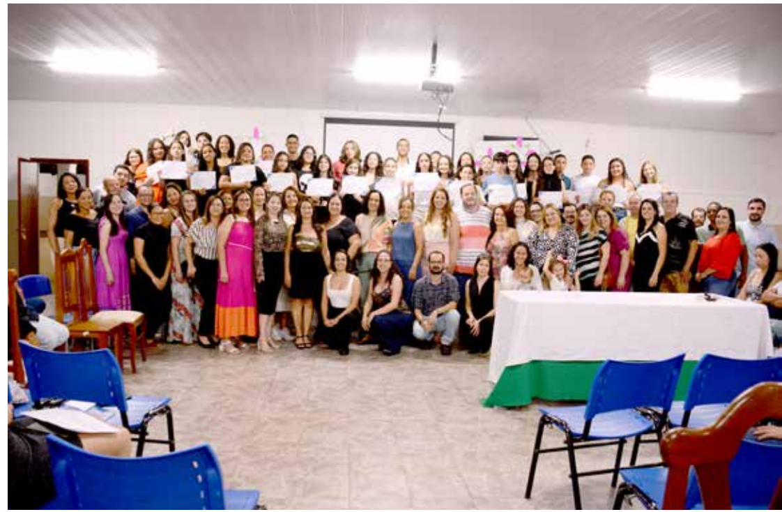
Alunos que se destacaram em 2023, juntamente com os professores e direção da escola

Na sequência da solenidade, deu-se início à entrega dos certificados de Melhores de 2023. Além do critério de melhores notas, a Escola entende que os bons alunos devem, além de ter boas notas e bom comportamento, ser responsáveis, proativos, lideranças positivas e pessoas gentis. Assim, foram chamados para receberem suas homenagens 37 alunos e alunas de todos os turnos e níveis de ensino que se destacaram neste ano. Para