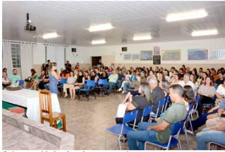
Pais e convidados dos alunos que estiveram presentes