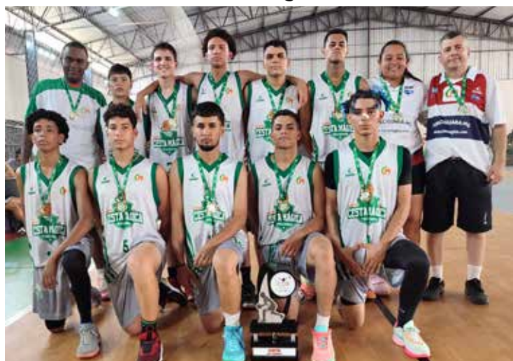
Equipe Cesta Mágica Masculina

JORNAL O INDEPENDENTE "Tupaciguara Acima de Tudo"