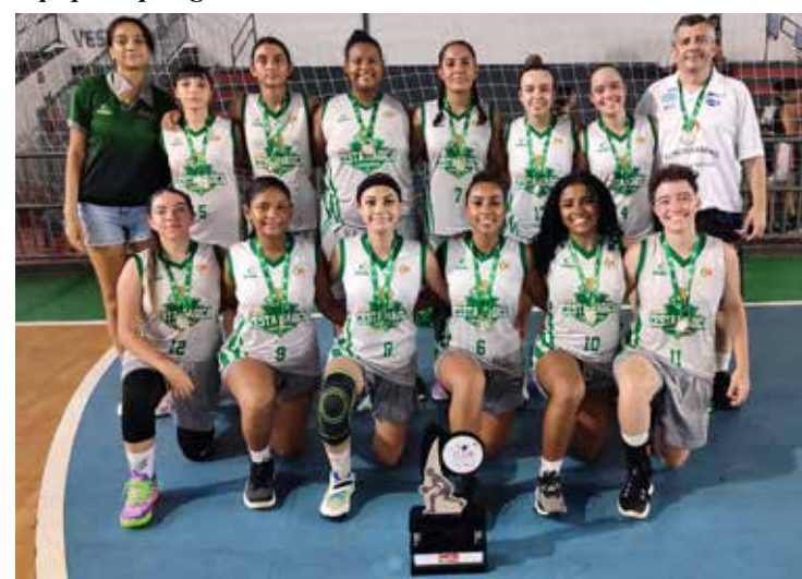
Equipe Cesta Mágica Feminina