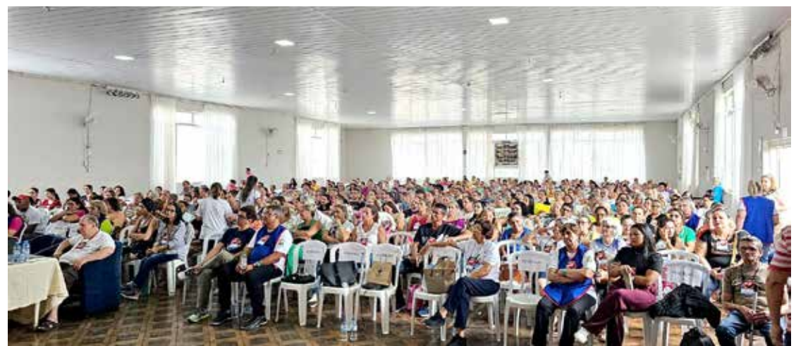
Presença expressiva de público no evento

No último Domingo (17), Tupaciguara foi palco de um encontro inédito. O FESTU – Fórum Espírita de Tupaciguara que reuniu católicos, evangélicos e espíritas para um diálogo em torno de assuntos e questões contemporâneas como: