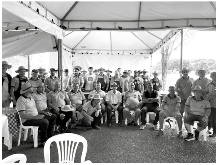
Parte dos maçons que compoem a Loja Ação e Trabalho

A comunidade de Tupaciguara aplaude a iniciativa da Loja Maçônica Ação e Trabalho e espera que o exemplo inspire outras organizações a se engajarem em ações que beneficiem a comunidade local.