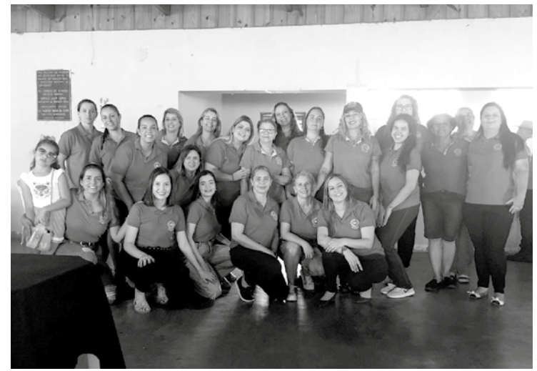
Parte das integrantes do Departamento Feminino Dirce Barbosa