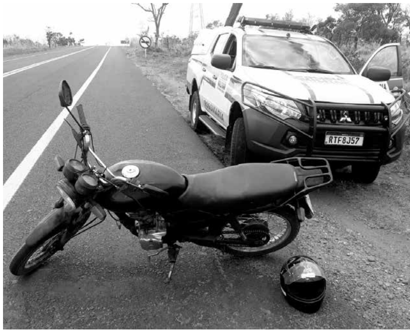
Moto que foi apreendida pela PRE

Tupaciguara, MG - Na última semana, precisamente no dia 14, às 20 horas, a Polícia Militar de Minas Gerais, por meio da Polícia Militar Rodoviária de Tupaciguara, realizou uma operação de fiscalização de trânsito na MG-223, nas proximidades do quilômetro 169. Durante a ação, os policiais, identifi-