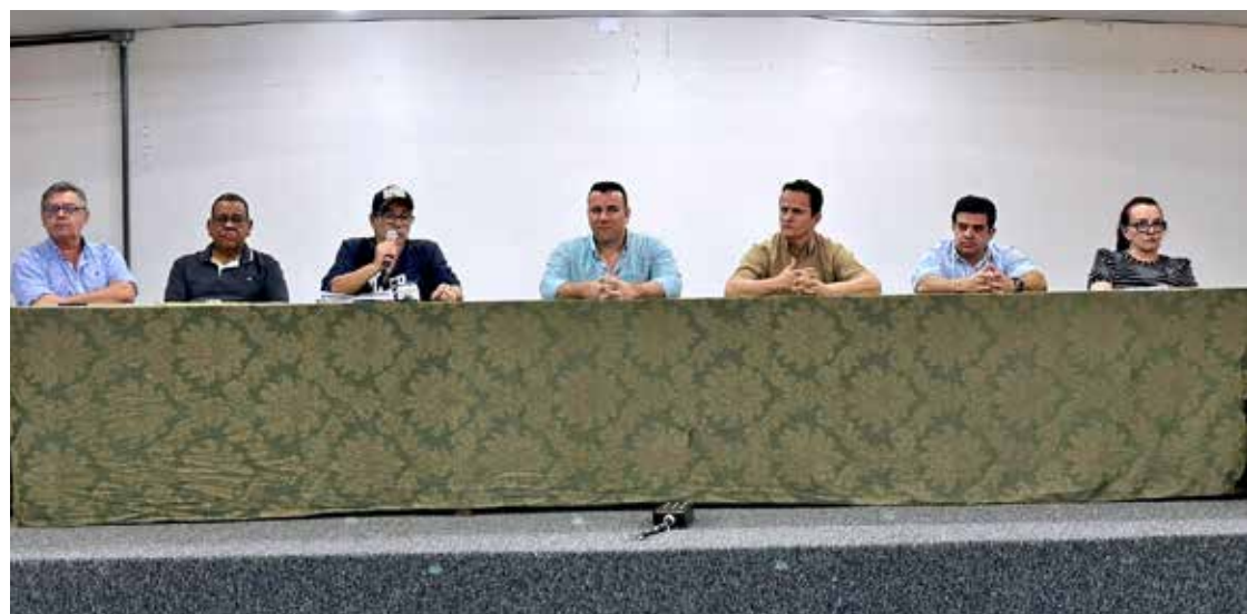
Autoridades e personalidades presentes na solenidade