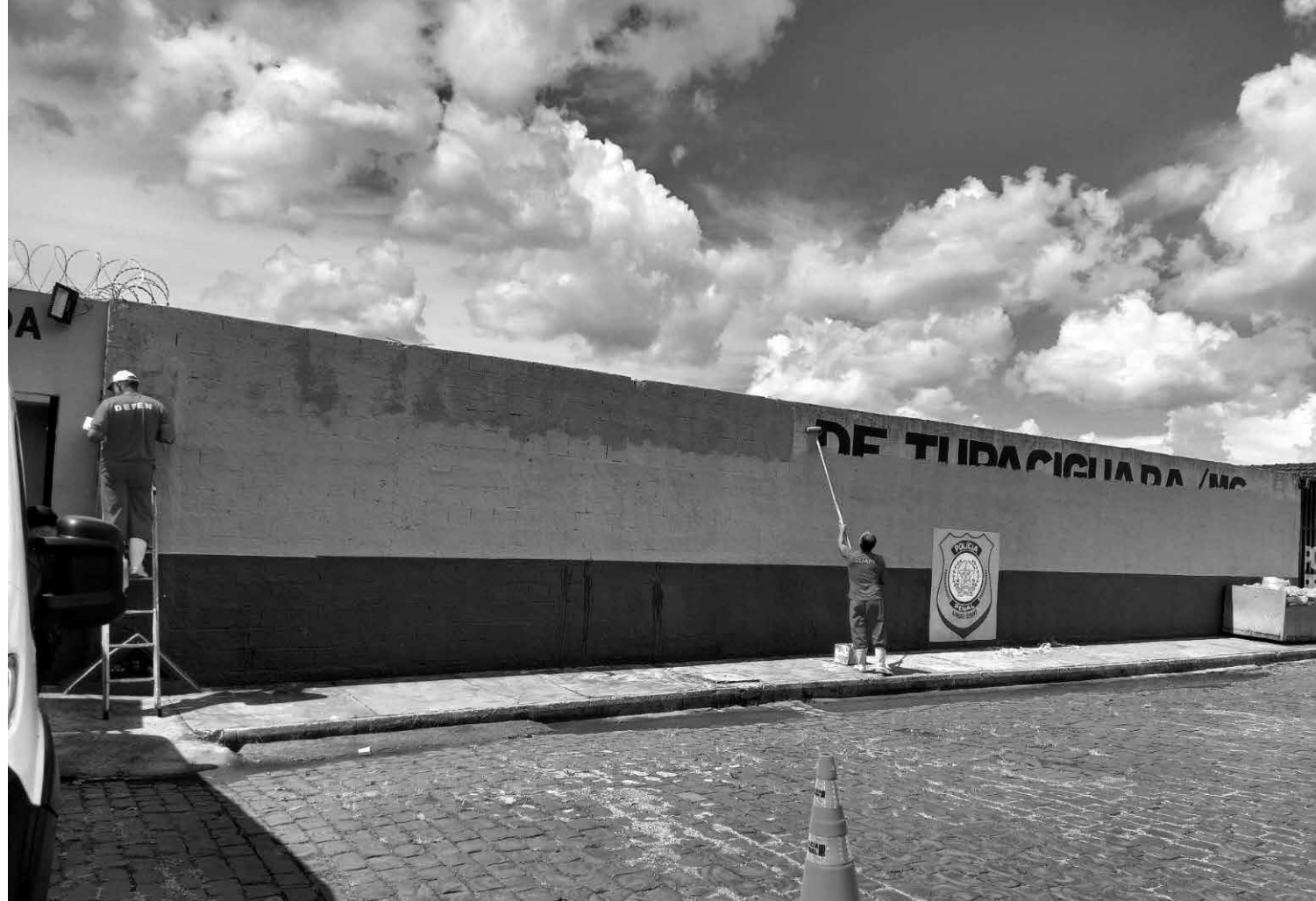
Detentos realizando nova pintura na fachada do presídio

áreas da saúde, social, jurídica e segurança, que avalia e seleciona presos para as atividades laborais. “Serão necessários mais presos para o trabalho, pois estamos em tratativas com a prefeitura de Tupaciguara para firmar uma parceria, na qual eles prestarão serviços na cidade. É importante termos o apoio de parceiros como o Executivo Municipal e a Justiça; precisamos muito deste compartilhamento de