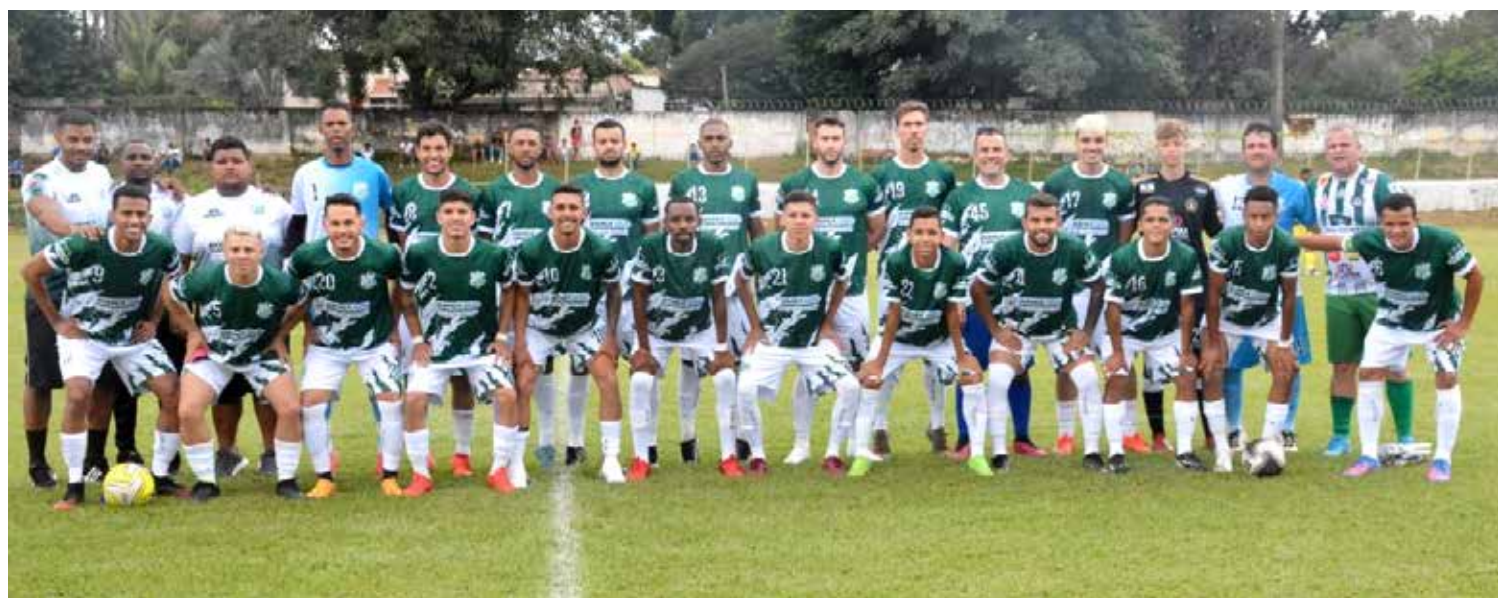
Equipe de Tupaciguara que está disputando a Copa Amvap

a equipe local e esperamos alcançar a vitória", disse.