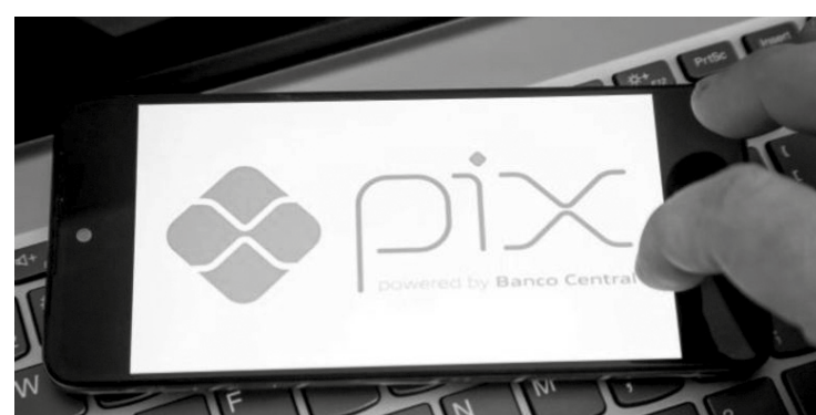
Luis Lima Jr/Foto: Arena/Estádio Conteúdo

Hoje, algumas distribuidoras já adotam a modalidade de pagamento, mas não há uma regra padronizada. Pela decisão da Aneel desta terça, a ferramenta passa a ser obrigatória e as empresas terão até 120 dias para oferecê-la, sempre que solicitada pelos consumidores. As distribuidoras tam-