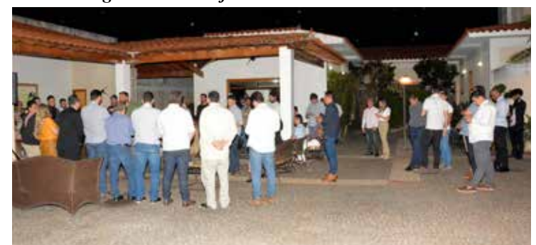
Convidados presentes à reunião