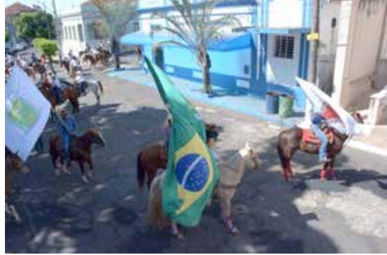
Cavaleiros e amazonas receberam a bênção