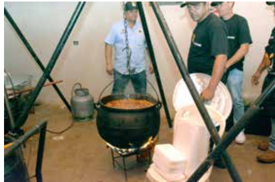
O tradicional arroz carreteiro, no fogo à lenha