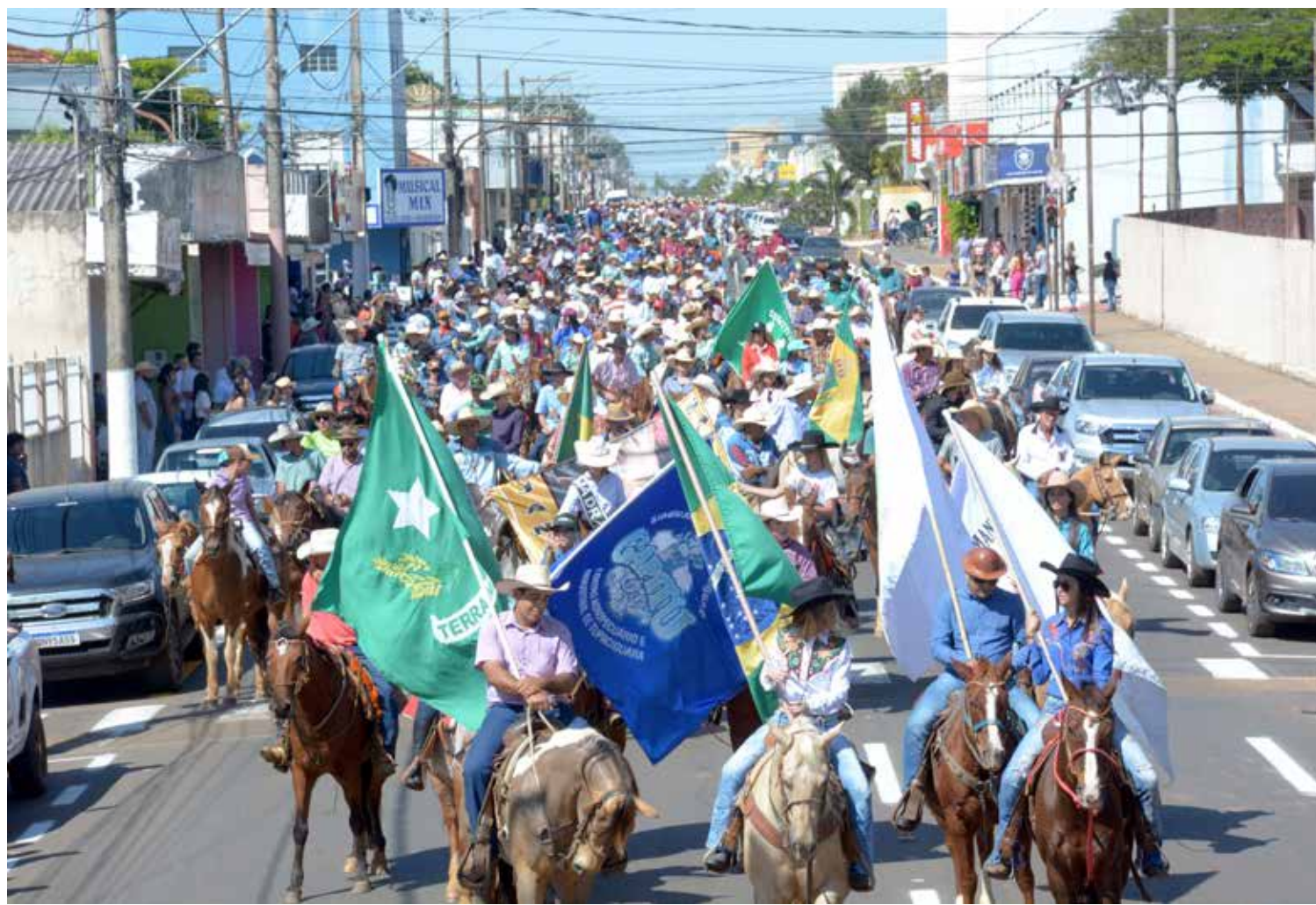
Segundo a organização do evento mais de mil cavaleiros e amazonas participaram da grande Cavalgada Dimas Neves

Na chegada ao Parque de Exposição Capitu, foi servido um almoço a todos os ca-