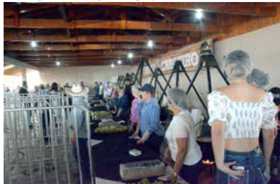
Equipe preparada para servir o almoço