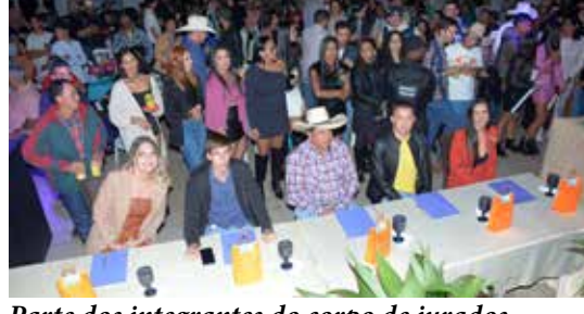
Parte dos integrantes do corpo de jurados