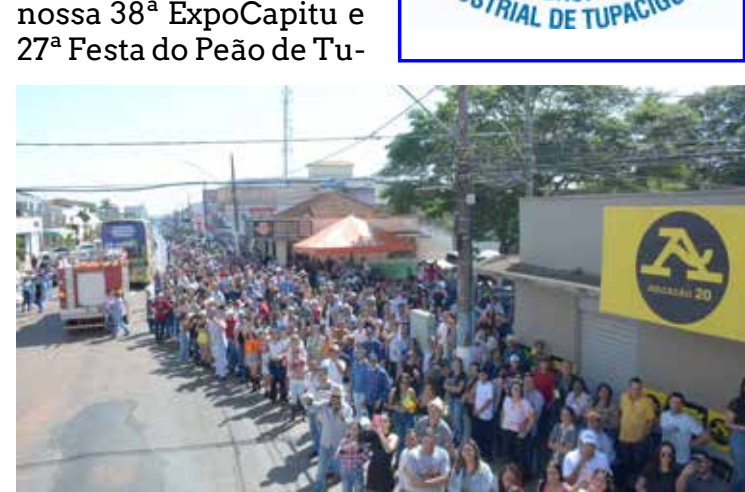
A população lotou às margens das duas vias públicas