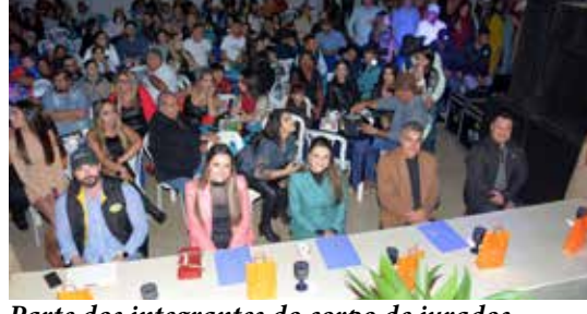
Parte dos integrantes do corpo de jurados