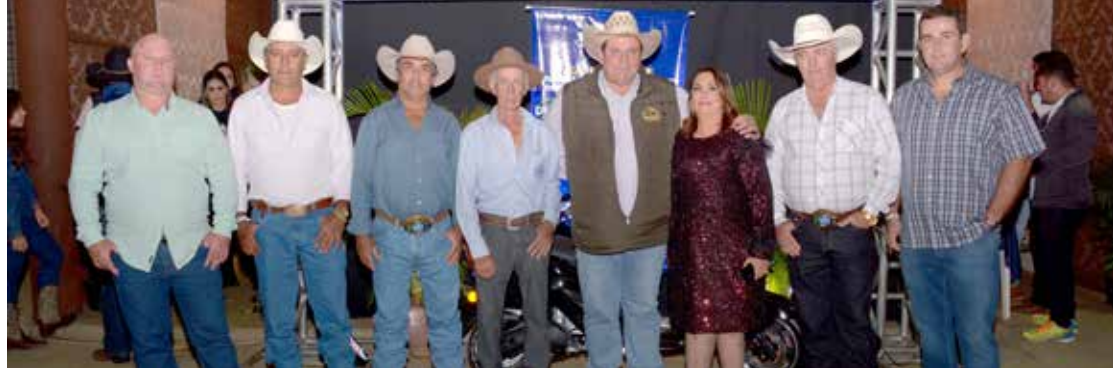
Parte dos integrantes da Diretoria do Sindicato Rural de Tupaciguara