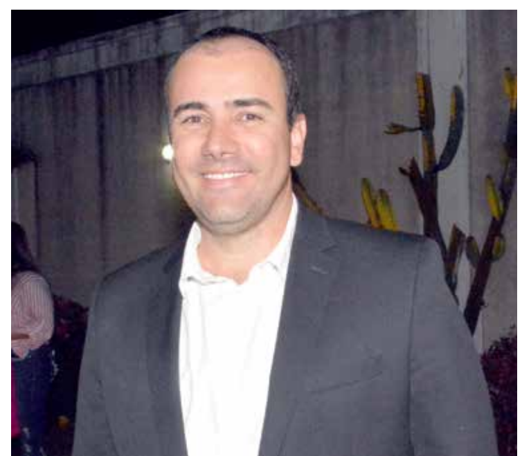
Prefeito Francisco Lourenço Borges