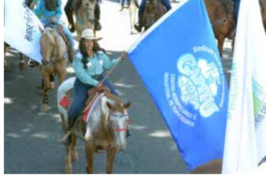
Bandeira do Capitu esteve presente