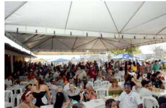
A adesão ao almoço foi expressiva