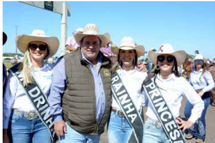
Presidente do Sindicato Rural com a rainha e princesas de 2022