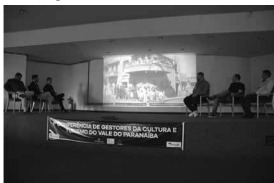
Um vídeo dos 110 anos de Tupaciguara foi mostrado aos presentes à conferência