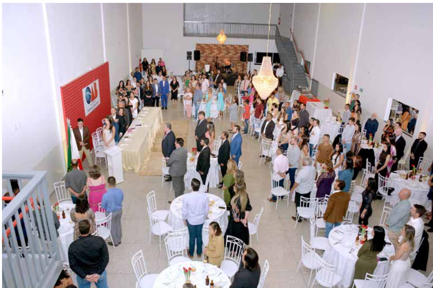
Vista panorâmica da solenidade de posse da nova diretoria da OAB de Tupaciguara