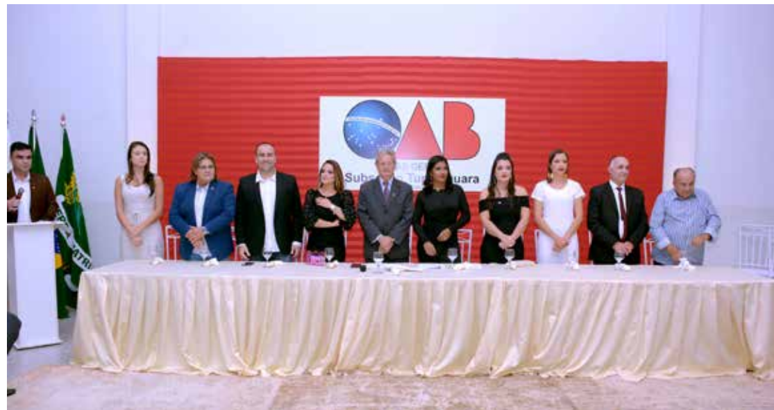
Mesa de autoridades e personalidades presentes à solenidade de posse