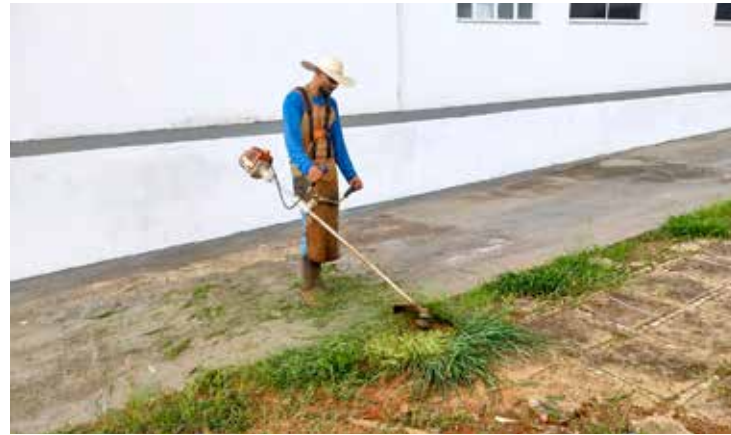
Servidores fazem o máximo para desenvolver a limpeza das ruas

É com muita alegria que CONVIDAMOS VOCÊ,