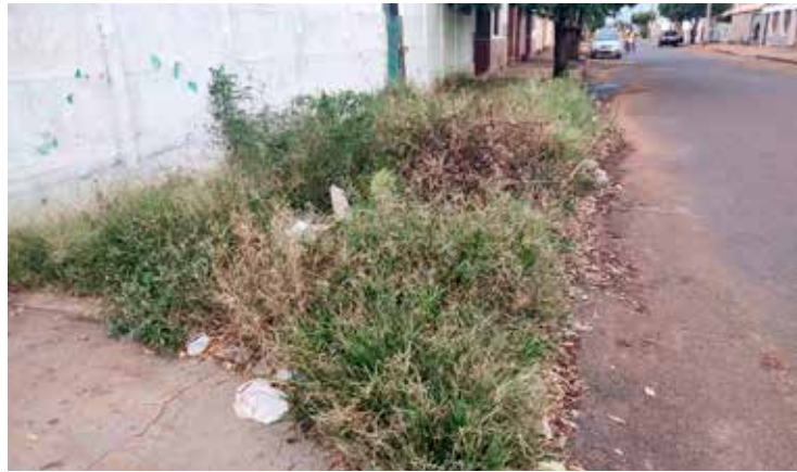
Onde não existe passeio, o capim tomou conta do espaço

Para a secretária, a solução de todos os problemas que envolvem a secretaria de meio ambiente, recursos hídricos e serviços urbanos está próxima de acontecer. Ela destacou, ainda, que mesmo dentro das limitações que hoje se encontra a secretaria, várias ações estão sendo realizadas, visando o bem-estar de toda a população e que a administração municipal está imbuída de fazer o melhor para o cidadão.