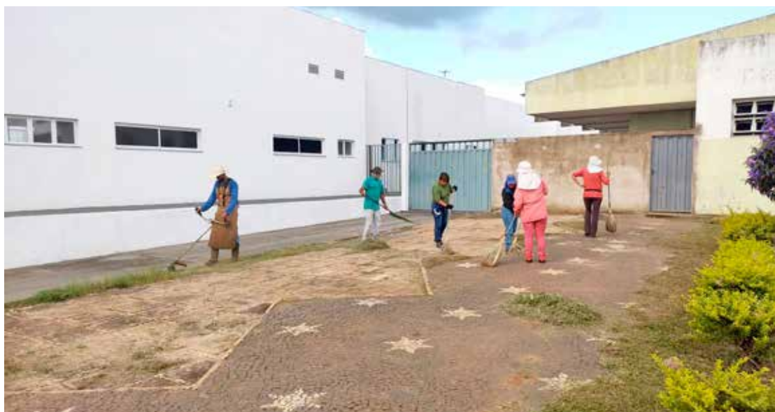
Servidores da Prefeitura realizando a capina e limpeza de vias públicas da cidade

O fato é que as reclamações se tornaram generalizadas, dando mostras de que a situação requer cuidados e ações rápidas para que o que se vê, não se torne uma imagem de abandono e desleixo, por parte da administração municipal. A população tem razão de reclamar sobre o que está acontecendo na limpeza pública. Por outro lado, o governo do município afirma que a sequência das chuvas, além