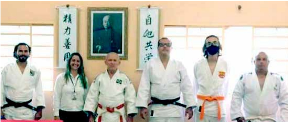
Composição da Mesa Principal do evento