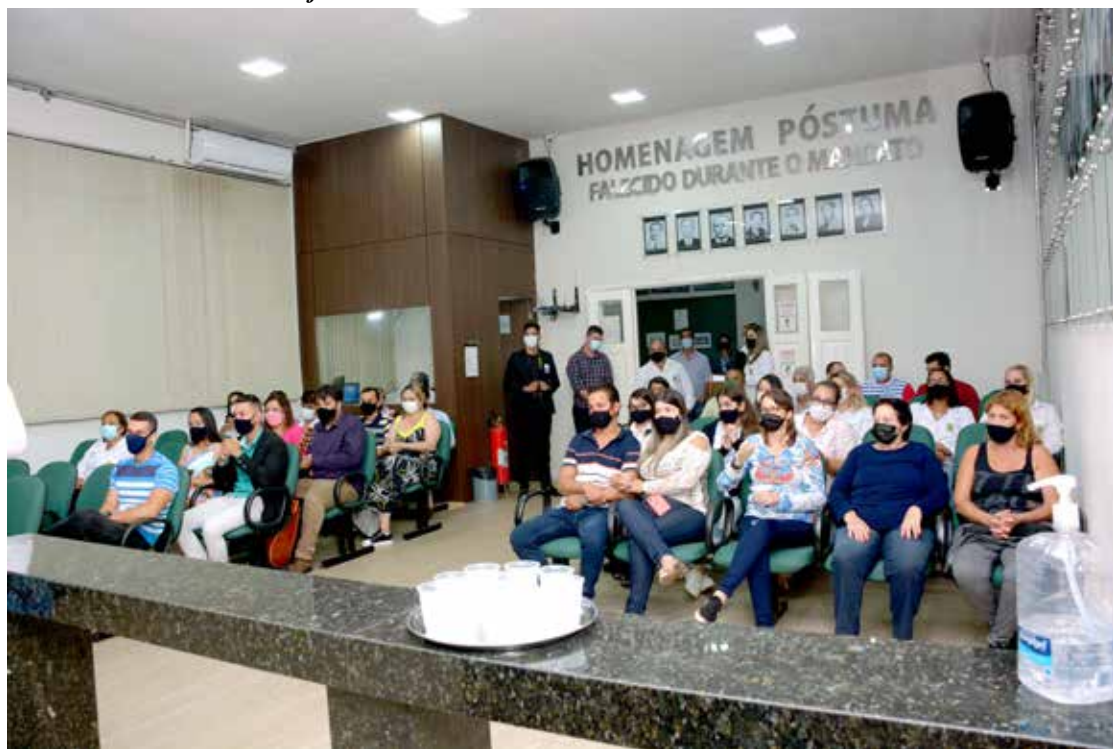
Pública presente à Sessão Solene de entrega de obras pela Câmara Municipal