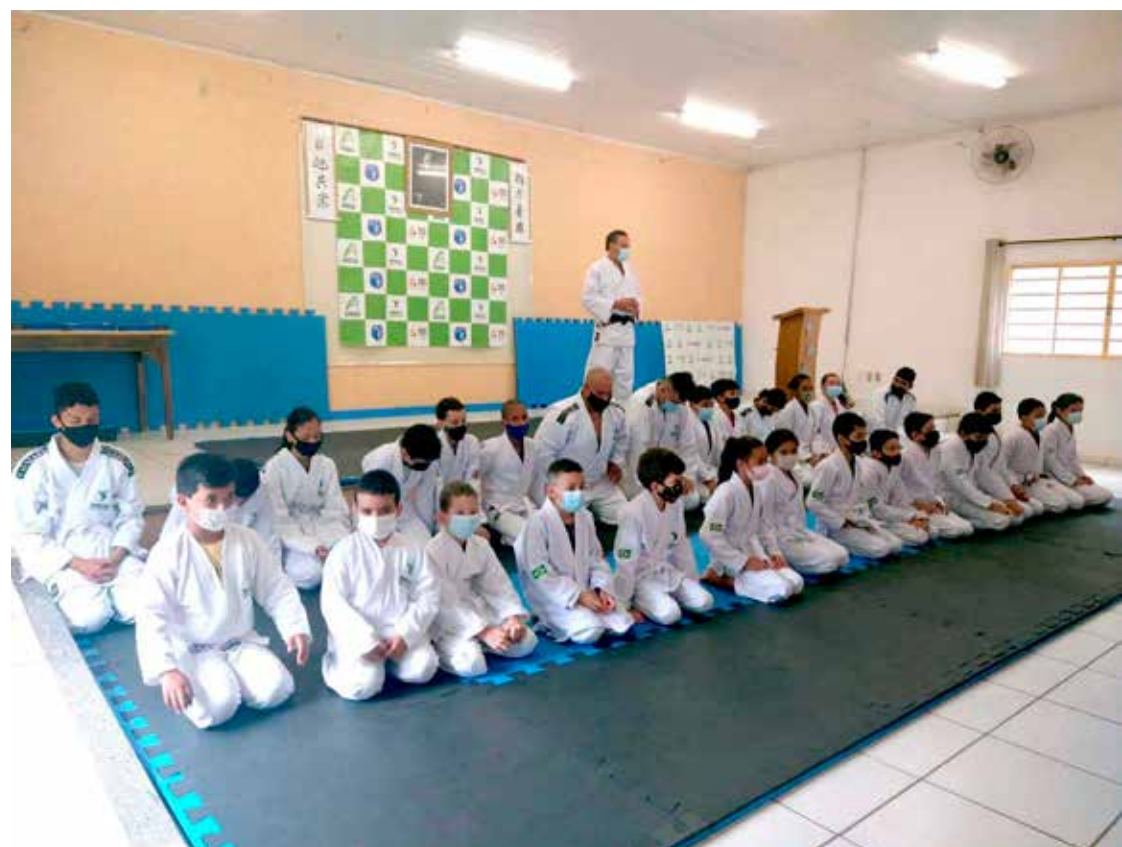
Primeira turma de judô de Tupaciguara.