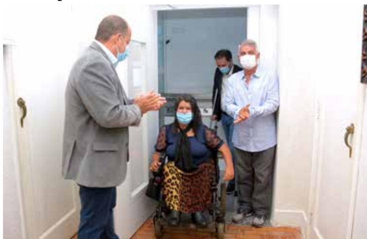
Os primeiros portadores de necessidade especiais a fazerem uso da nova plataforma