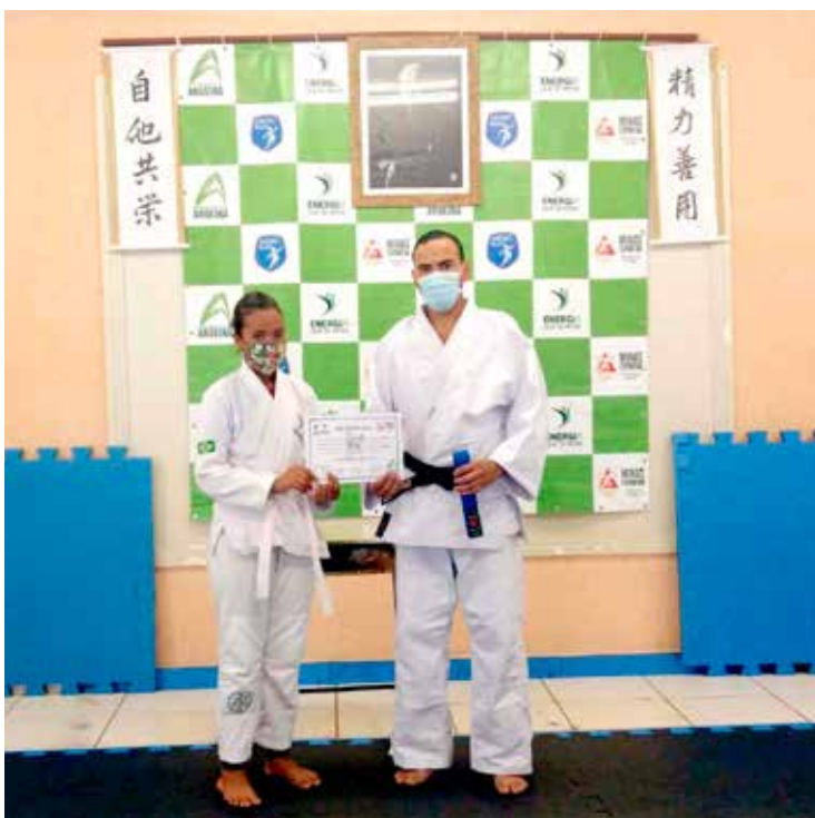
Entrega de faixa e certificado