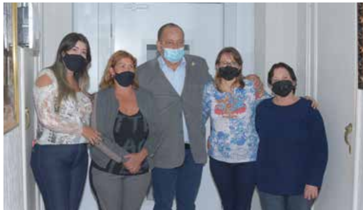
Presidente da Câmara com familiares do Marcinho