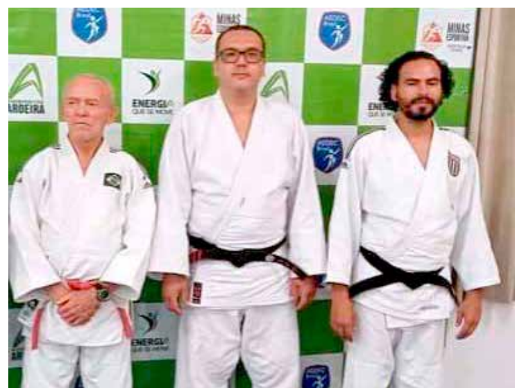
Integrantes da banca examinadora.

vas vagas, a partir de 10 de janeiro de 2022, para as idades entre 8 e 16 anos. É necessário comparecer no Colégio Clertan, no bairro Paineiras, nos dias: terça, quarta e sexta-feira das 8 às 11 h ou das 15 às 18:30 h, para realizar a matrícula e os treinamentos.