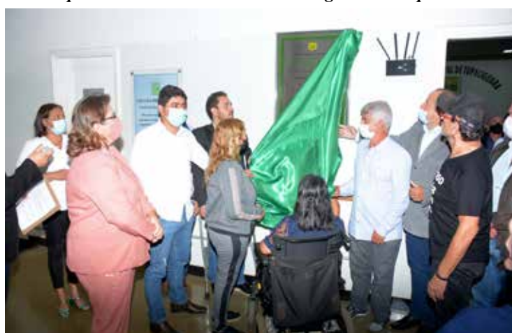
Descerramento da placa inaugural das obras realizadas