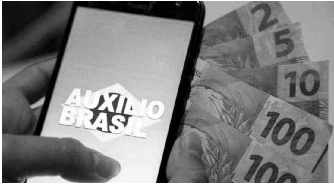
O Auxílio Brasil começou a ser pago a partir desta quarta-feira (17)

Além dos imunizantes contra sarampo, caxumba, rubéola, varicela, hepatites A e B, meningite, poliomielite, febre amarela e rotavírus, a vacina contra Covid-19 também poderá entrar no calendário nacional infantil, caso a