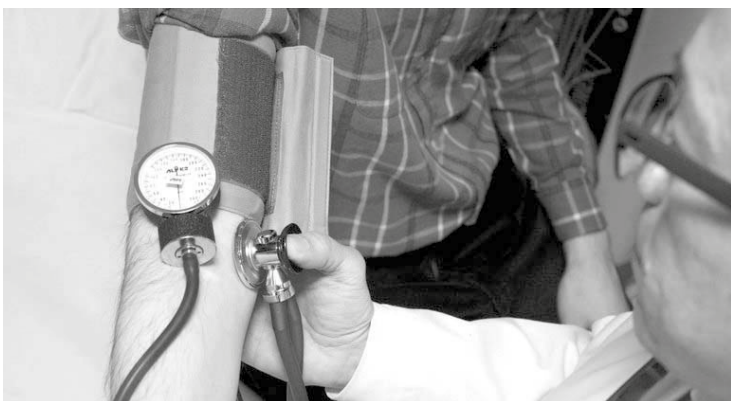
Tempo sem ir ao médico pode resultar em diagnóstico tardio de doenças

“O grande problema de não ir ao médico regularmente é a falta de diagnósticos, doenças como câncer, diabetes ou hipertensão podem ficar sem ser detectadas por muito tempo, dificultando o tratamento no futuro. Nes-