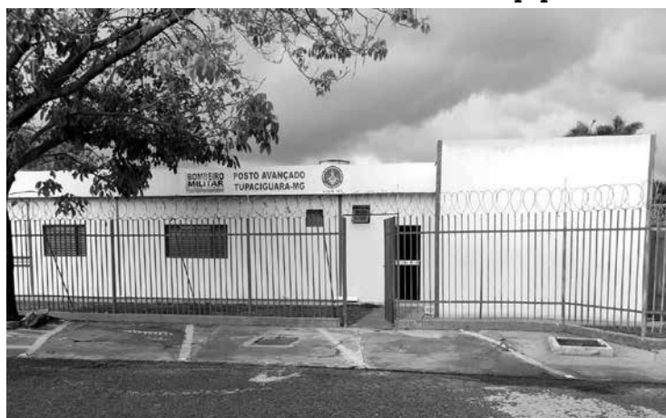
Entrada principal do Posto Avançado (Rua Elias Teotônio)

A data certa para a inauguração da unidade, será divulgada pelo comando do Corpo de Bombeiros, para que todos possam participar desta importante conquista para Tupaciguara e as cidade beneficiadas.