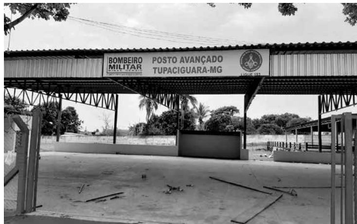
Entrada e saída operacional do Posto Avançado (Av. Belo Horizonte)