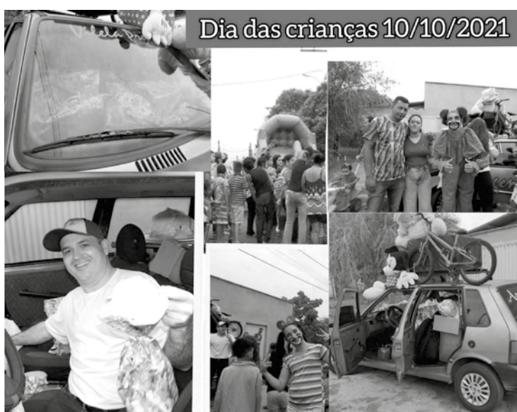
Registro de alguns momentos da festa