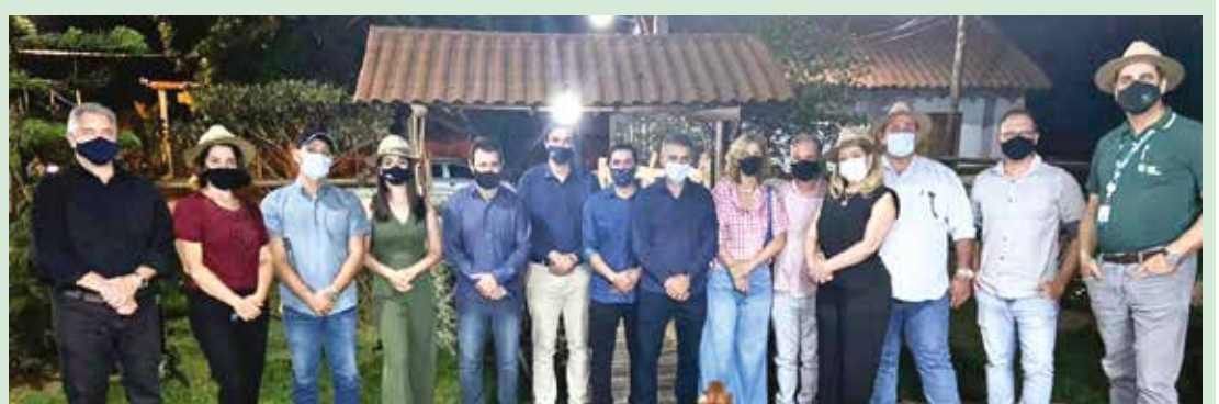
VEJA NA PÁGINA 06