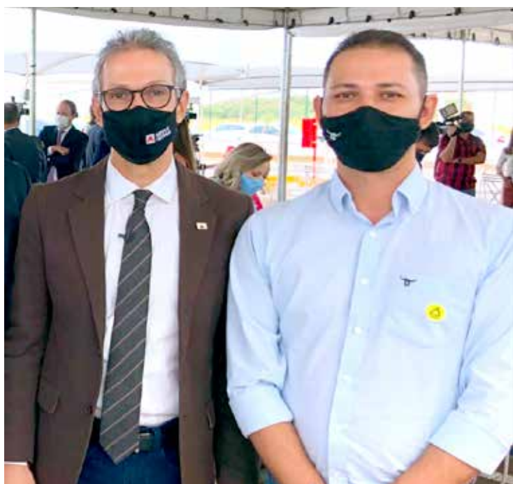
Romeu Zema e Moacir Júnior

Um dos caminhos procurados pelo vereador foi o envio do ofício 0129/2021 ao governador Romeu Zema, solicitando que o governador analise junto ao Comitê de Enfretamento da Covid 19 e demais órgãos estaduais diretamente ligados à pandemia, a possibilidade da inclusão dos trabalhadores do comércio, com idade superior a 18 anos, na relação de profissionais considerados essenciais ao