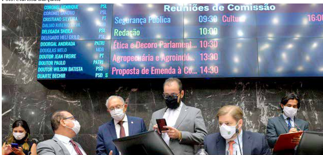
Projeto aprovado em definitivo pelos deputados estabelece horários para os serviços de telemarketing e cobranças

lefone de segunda a sexta-feira, das 9 às 18 horas, e aos sábados, das 10 às 13 horas. A matéria foi aprovada com a emenda nº 1, aprovada em Plenário sem parecer.