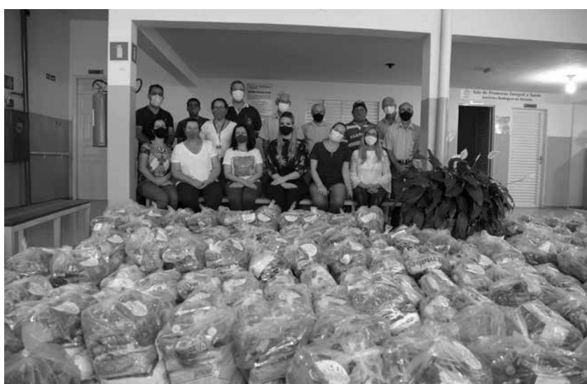
Parte dos organizadores com representantes das entidades beneficiadas

O abrigo Hilda Vilela, a Paróquia Nossa Senhora da Abadia, o CEAMI, Casas Lar 1 e 2, Rotary Club, Centro de Convivência João Paulo II e a Prefeitura Municipal, por meio das Secretarias Municipal de Desenvolvimento Social e de Saúde, foram algumas das instituições beneficiadas. Cada uma destas entidades possui, em seus setores de cadastro, o nome de pessoas ou famílias em risco de vulnerabilidade que serão contempladas com cestas básicas, materiais de higiene e de saúde, de acor-