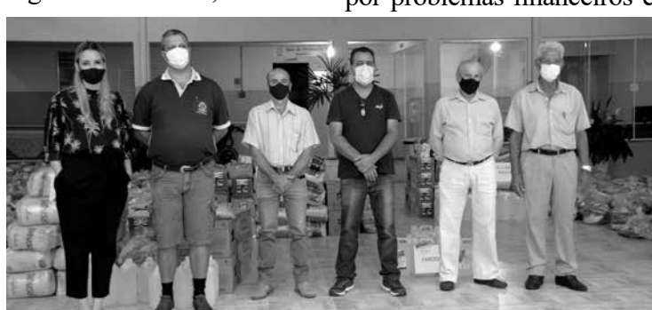
Presidente da Apae com representantes das entidades beneficiadas

As doações ainda podem ser feitas até o final deste mês nos pontos de arrecadação: Apae, ACIT/CDL e Sindicato Rural ou pela conta do Lions Clube de Tupaciguara - SICOOB CREDITRIL - Banco 756 - Agência 3224-7 - Conta corrente 20.618-0 CNPJ 21.239.124/0001-02 e Chave PIX: lc17066@yahoo.com.br