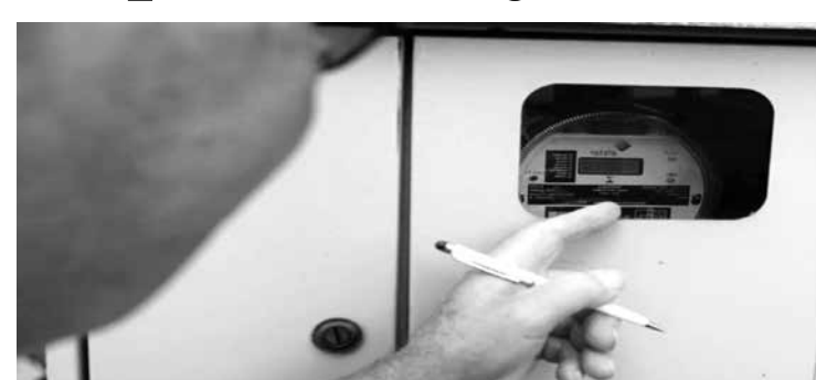
Custo de geração de energia

Essa bandeira deve vigorar pelo menos até novembro, quando tem início o período úmido.