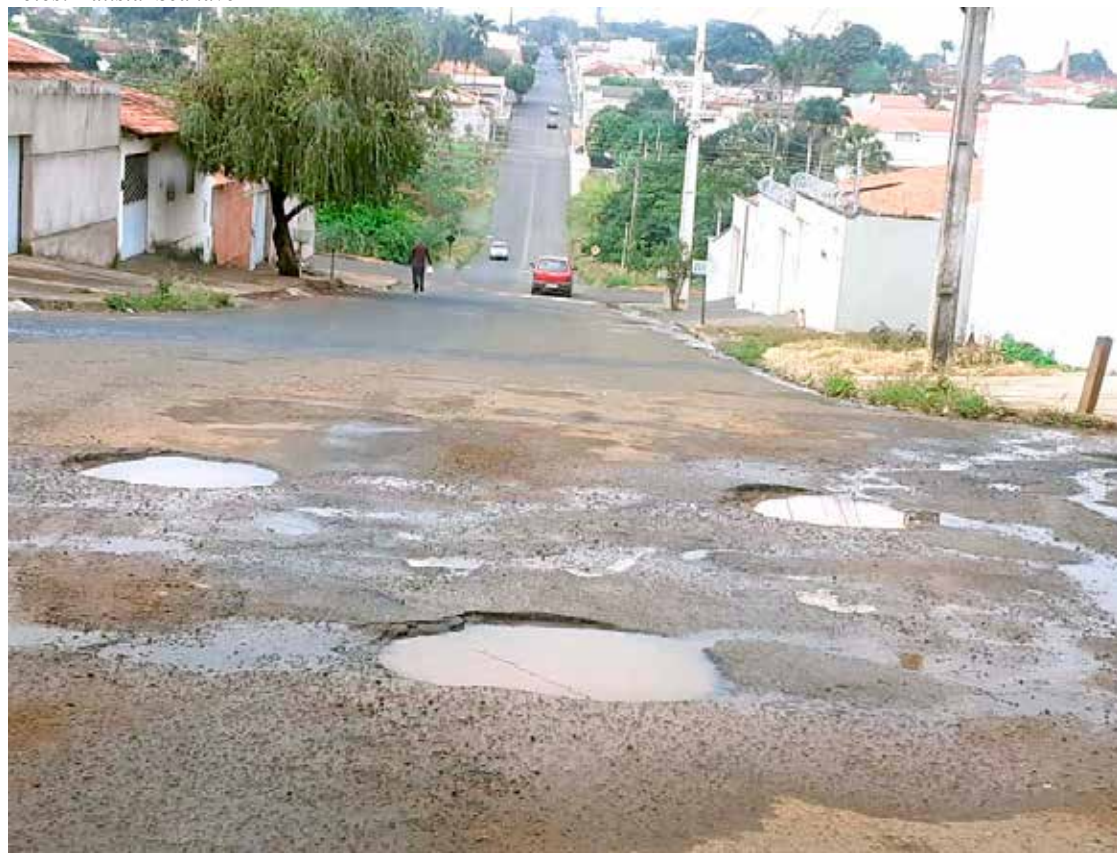
Alguns dos muitos buracos que, segundo moradores, infernizam os cidadãos do Morada Nova para não ser identificado, por medo de represálias.

Pelo que se ouve em todas as localidades da cidade é que ainda não se viu e nem foi sentido o NOVO JEITO DE GOVERNAR do prefeito municipal. Como mesmo disse o cidadão, a pandemia não pode ser usada como instrumento de justificativa para a falta de ação em