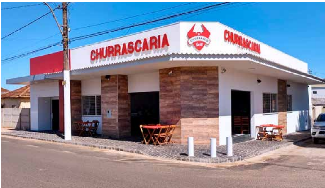
Fachada das instalações da Churrascaria Grill