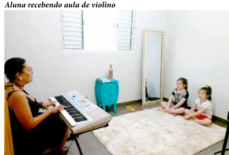
Duas alunas tendo aula de canto