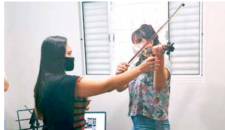
Aluna recebendo aula de violino

Venha fazer parte dessa realidade você também! Estamos em novas instalações na Av. Antônio Alves Machado, 94 – bairro Tiradentes – próximo da Prefeitura. Telefones: 34 9 9130-2349 e 9 8878-3247.