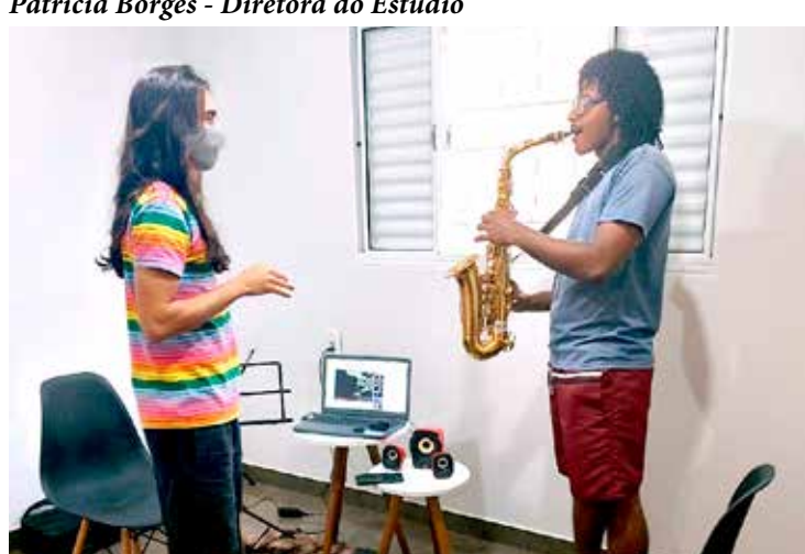
Aluno recebendo aula de saxofone