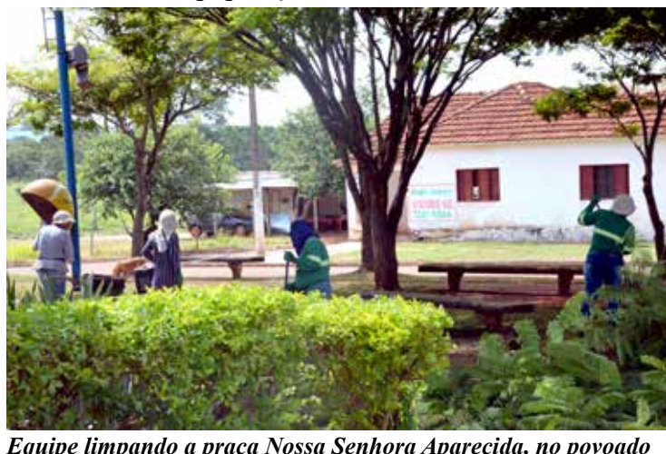
Equipe limpando a praça Nossa Senhora Aparecida, no povoado do Brillante