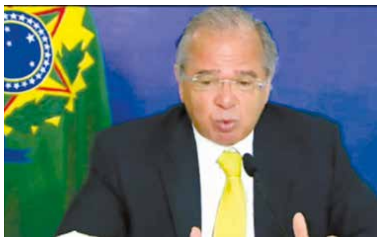
Guedes criticou atual presidente da Câmara

O ministro da Economia, Paulo Guedes, afirmou nesta terça-feira (26) que o governo federal pode adotar o “protocolo da crise” caso aumente o número de mortes de covid-19 no país. A medida, esclareceu, representaria a proibição temporária de aumento de salários aos servidores públicos.