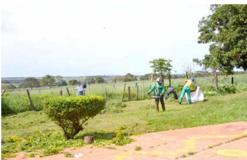
Roçagem nos arredores do povoado do Brillante

A Prefeitura de Tupaciguara, por meio da Secretaria de Meio Ambiente, Recursos Hídricos e Serviços Urbanos, tem trabalhado desde o início do governo limpando a cidade e conscientizando a população.