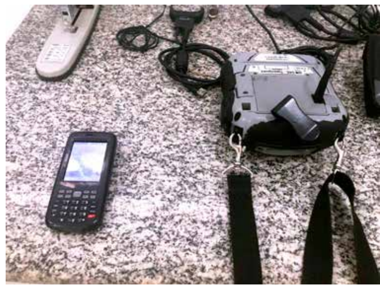
Parte dos novos equipamentos adquirida pela nova gestão do DAE

DAE e PREFEITURA inovando para dar mais qualidade de vida à população.