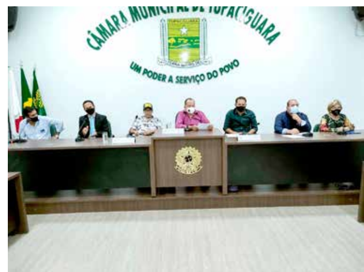
Mesa Diretora da Câmara Municipal