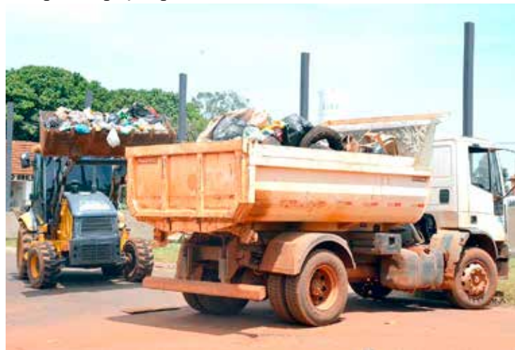
Máquinas realizando a retirada de entulhos

A Secretaria informou ainda que a partir do primeiro dia de fevereiro será iniciada a coleta de entulhos por toda a cidade. O cidadão será comunicado sobre quando o mutirão vai acontecer em cada bairro.