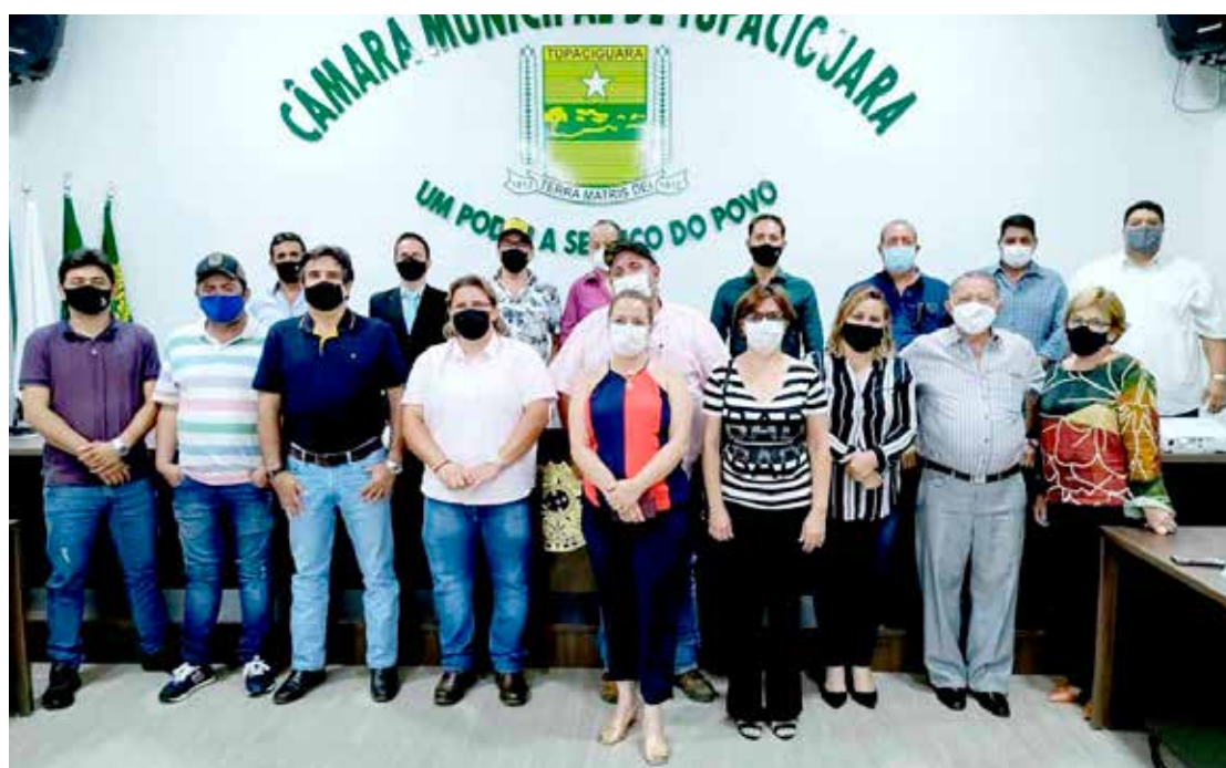
Parte das pessoas participantes da reunião