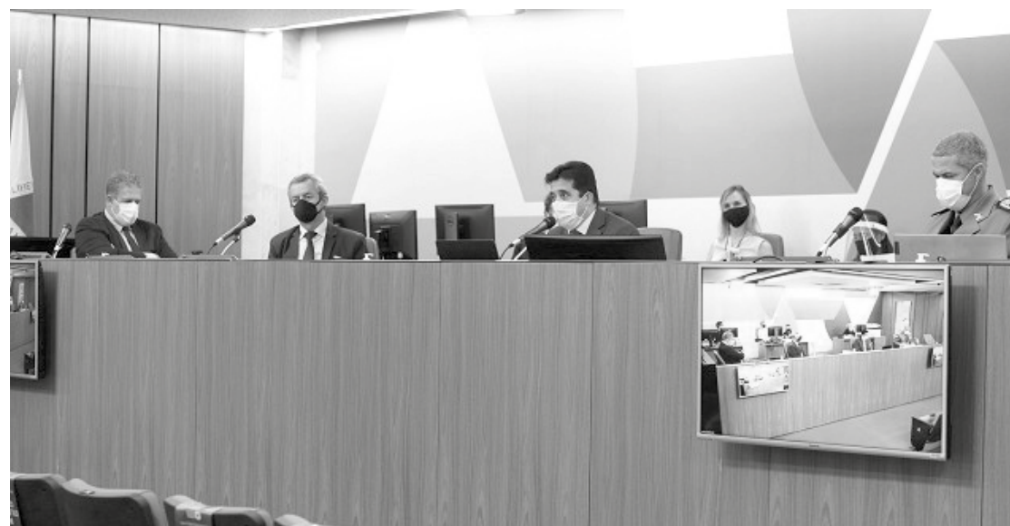
Deputados ouviram representantes das forças de segurança do Estado na reunião do Assembleia Fiscaliza

são foi o primeiro a se dirigir ao comandante-geral da PM, coronel Rodrigo Sousa Rodrigues. Este respondeu que já foram chamados para o curso de formação de soldados 870 aprovados em concurso. Segundo ele, a atuação dos novatos fez a diferença no atendimento da PM durante a pandemia.