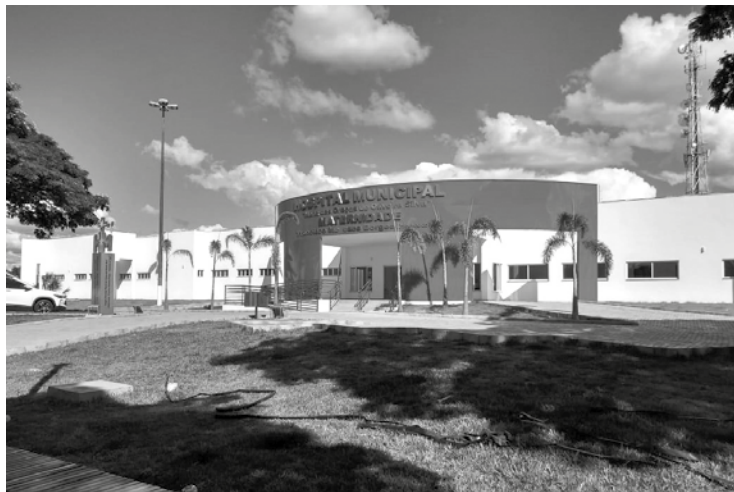
Fachada do Hospital e Maternidade Municipal que vai ser entregue última entrega o hospital e jamento, podem ocorrer mudanças no cronograma de entrega.

Não tivemos acesso à programação, nem ao número de inaugurações e nem mesmo quais serão as obras que a administração pretende entregar à população tupaciguarense, mas, a priori, elas irão até o dia 28 de dezembro, tendo com