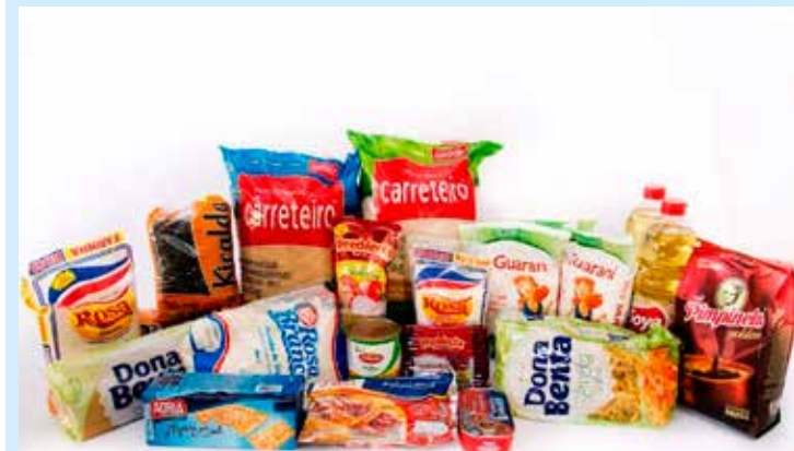
Imagem de alimentos meramente ilustrativa

Queremos continuar a semana com o coração cheio de alegria. E você? Torcemos que sim! Então, vamos lá!