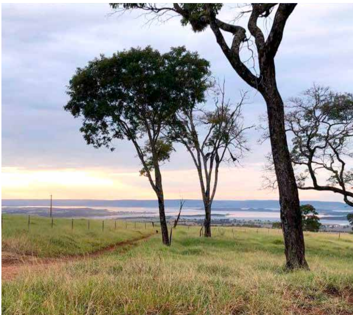
Uma pequena e linda vista da vasta área que abriga a região da Confusão em Tupaciguara